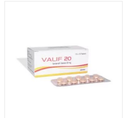
VALIF 20 MG