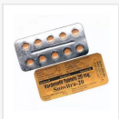
SNOVITRA-20 MG €26.00