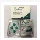
SUPER LEEFORCE €14.50