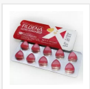
FILDENA EXTRA POWER-150 MG €26.00