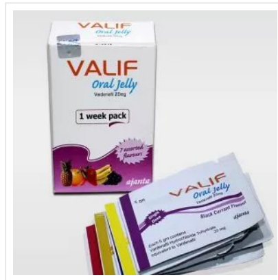
VALIF ORAL JELLY 20 MG